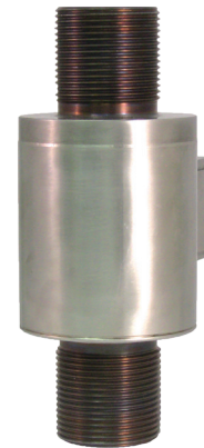
Тензодатчик растяжения/сжатия, модель F2226

Тензодатчик растяжения/сжатия имеет защиту от водяных брызг и отличается надежностью даже при работе в сложных условиях эксплуатации.